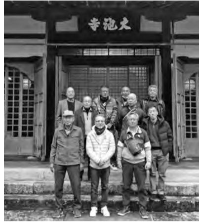
大池寺山門前にて

報告・活動計画・会計報告・今年度予算審議・中建国保も含めて全て承認されました。昼食を摂ったのち、「総