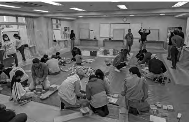
漆喰塗り体験や木工作をされる参加者皆さん

「いこま空き家流通促進プラットホーム」主催による活動です。自宅をDIYでリフォームするためのコツを学ぶために建築職人と建築士に教わりながら、大人はクロス貼りと壁の漆喰塗り体験を行いました。子どもは