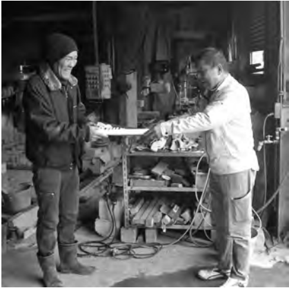
役員で支部管内の現場や作業場をパトロール

世情厳しい折、また年末で何かと忙しい時期ではありますが、安全第一で現場や車の運転等事故災害のないように声