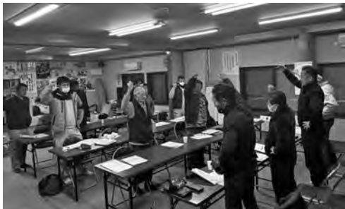
12名全員が出席し大会を開催