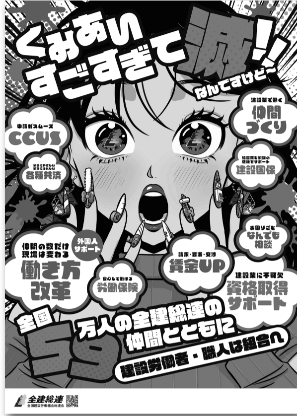
全建総連の春の組織拡大ポスター