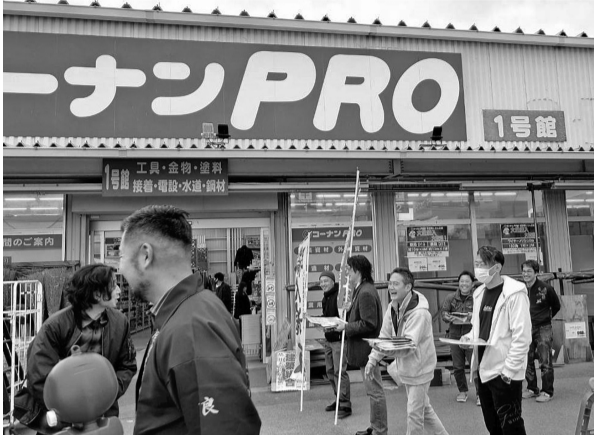
コーナンプロ三条大路で拡大行動

組合パンフに記載している労災や中建国保の魅力について、現場に従事する職人さん達と一緒に見て貰って、建築組合の存在と加入の意識付けになればと思うと