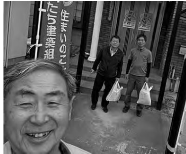
役員3名で香芝市内の拡大行動へ

春桜満開の中、交通安全週間もスタートし、建築組合の組織拡大強化行動週間も始まりました。4月10日の7時30分から9時まで香芝コーナンプロにて朝宣伝運動を香芝支部・北葛支部・本部書記局とで行いました。朝早くからご苦労様でした。 北葛支部はその後本部の宣伝カーをお借りし、支部の車と2台で、あいにくの激しい雨中、組織拡大パトロールを行いました。世情厳し い中、役員さん宅や事務所また倉庫・工場等を訪問しながら街宣パトロールとなりました。 ある材木工場では作業の安全最優先と未加入者の紹介、ポスター掲示、イベント参加等の組合のアピールなどをティッシュやパンフレットと共にお願いをし、また、セニア会員さんの工場や事務所では世情やいろいろなア