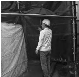
雨の中、現場訪問で声掛け