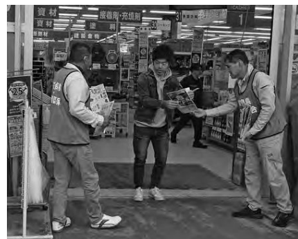
来店者へ声掛けをされる役員さん

重ねていくことで今後の大きな成果に繋がると信じています。配布した宣伝物を現場等で使用しても構いません。また、組合の力が弱くても、その力を集めて組合が大きくなることで、国や地方自治体は要求に耳を傾けます。建築労働者・職人の結集を大きくすることで諸要求を実現し、仕事と