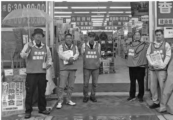
香芝と北葛支部の役員さんが連帯協力

4月と5月の組織拡大強化月間において、各支部では新規加入者目標の達成に向け、現場訪問行動や組合員宅訪問を統一運動意識として取組んでいます。各支部では組合員さんの現場や作業場をはじめ、大手住販メーカーや建売分譲現場、町場の現場を訪問し、未加入者がいれば組合パンフやポケットティッシュを手渡して組合加入をお願いしています。組合員事業所等においてもポスターやのぼり旗を掲げる宣伝にご協力頂いています。現在は様々な情勢から仲間が「自然発生的」に増えることはありません。何らかの行動を起こさなければ仲間が増えることはありません。役員や組合員・書記局から実践・行動に移していくために組合の存在を知ってもらう行動として、近隣支部同士が連帯協力し、コーナンプロやビバホームでの朝宣伝行動を進める計画を立て、年4回、コーナンプロ香芝・三条大路・西大和店、ビバホーム橿原の4店舗を巡回する形で実施します。